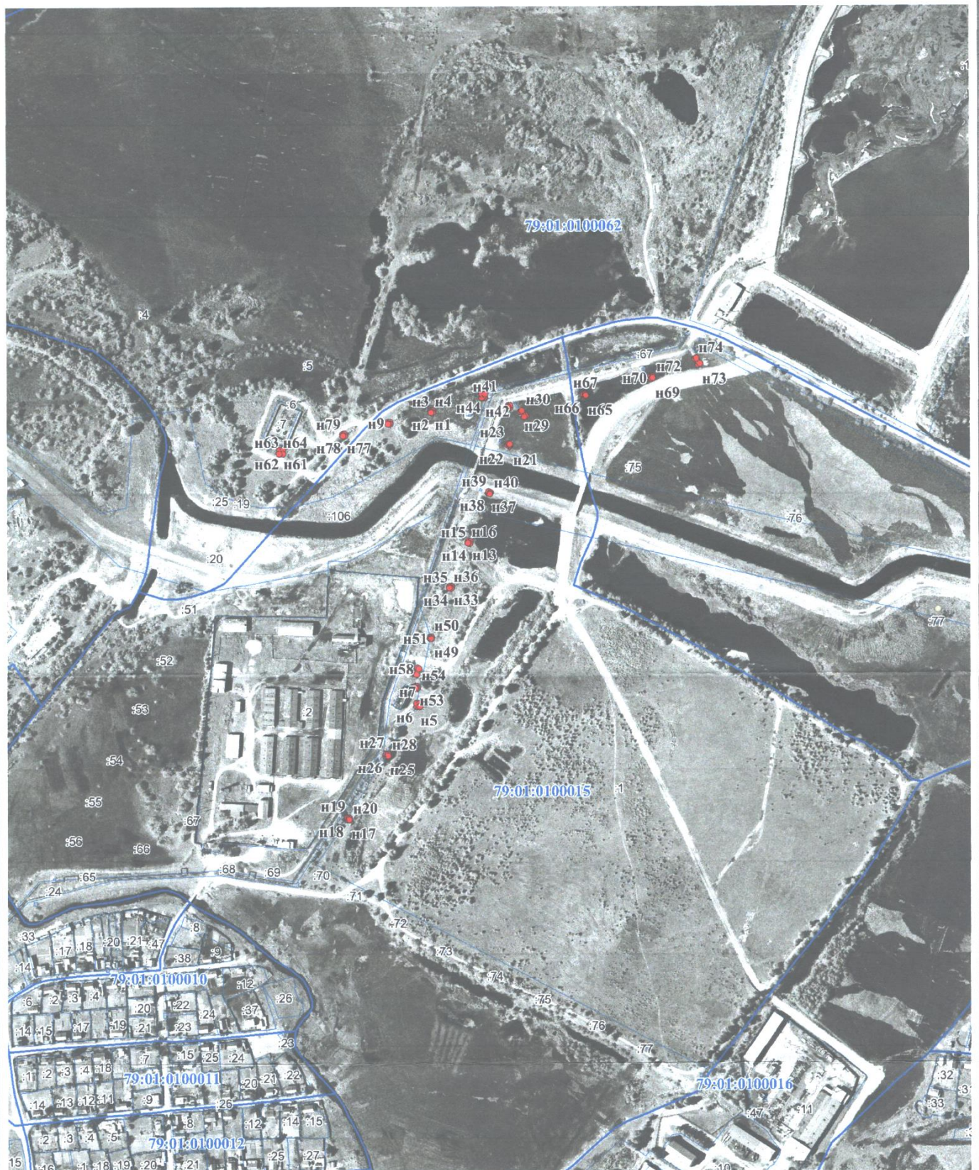
Схема размещения границ публичного сервитута